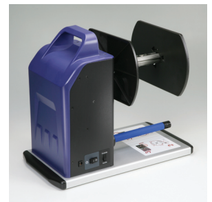
兼顧造型與實用性的外觀設計