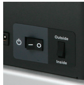
回捲方向開關 可切換內捲紙及外捲紙