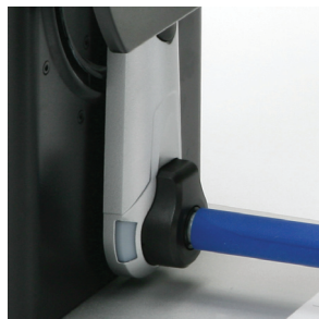
LED顯示燈號 可隨時顯示回捲機使用狀態